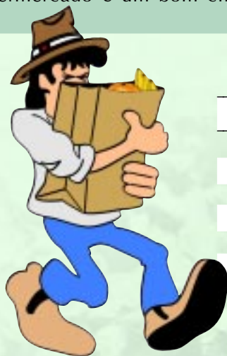
Tabela 1. Supermercado é um bom cliente? Veja a opinião dos produtores.

Cerca de 60 produtores dos nove produtos analisados pela Hortifruti Brasil, que negociam diretamente com o supermercado, foram entrevistados em fevereiro e março. Procurou-se analisar o nível de satisfação do produtor com o "cliente" supermercado, em comparação aos outros compradores (ceasas, varejões, feiras-livres). Os produtores também citaram os pontos que consideravam conflitantes na negociação com o supermercado. A mesma entrevista foi feita com quatro representantes das grandes redes de supermercados do Brasil. A