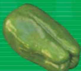
Pimentão Híbrido Impacto