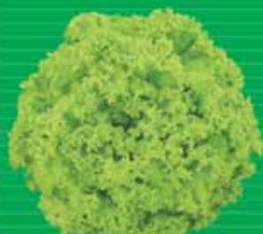
Alface Crespa Solaris